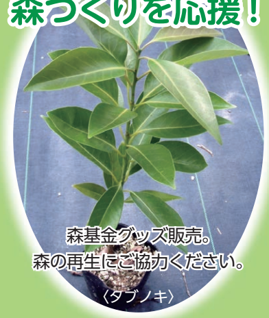
森基金グッズ販売。 森の再生にご協力ください。 (タブノキ)